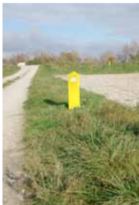
Borne indiquant la présence souterraine d'un gazoduc.

Les niveaux de pression sont très importants dans les canalisations de Transport de Matières Dangereuses. Des défaillances, liées aux endommagements causés par des travaux réalisés à proximité ou du fait d'un percement par corrosion, peuvent générer des fuites, des inflammations, avec des effets très graves pour l'homme et l'environnement : pollutions des sols, explosions, intoxications, brûlures. En 2004, à Gonfreville l'Orcher, une fuite de gazole a atteint le canal de Tancarville suite à un percement par corrosion. L'accident ayant eu l'impact le plus grave sur l'environnement est celui qui a eu lieu en 2009 sur 5 ha dans la plaine de la Crau, à l'intérieur d'une zone naturelle protégée. Les conséquences peuvent impacter l'homme comme à Rosteig en Alsace en 1989 (3 morts) ou à Magland en Savoie en 2004 (2 blessés). Toutefois, au regard des volumes transportés par canalisation, ce moyen reste plus sûr et moins polluant que si ces volumes étaient acheminés par voie terrestre.